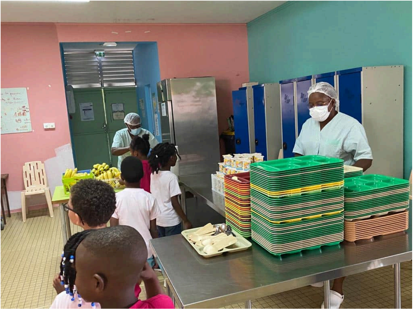
Semaine du goût 2023 – Opération « Ti Dèj a Tibou »