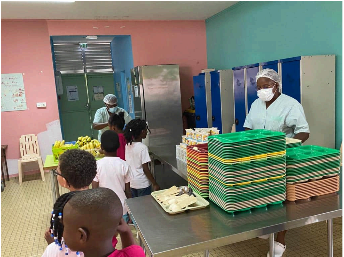
Semaine du goût 2023 – Opération « Ti Dèj a Tibou »